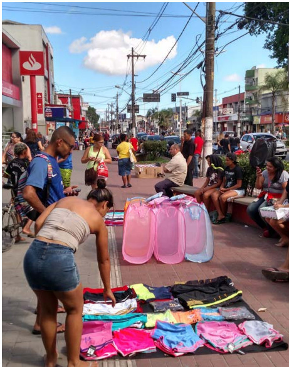
O presidente da Associação Comercial e Industrial de Cubatão, ACIC, questionado pela nossa reportagem, mostrou-se muito preocupado com a invasão de ambulantes na Avenida 9 de Abril e garantiu que vai oficiar a Prefeitura de Cubatão, para que medidas imediatas sejam tomadas, para acabar com essa farra dos ambulantes em nossa principal avenida.