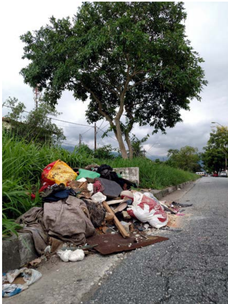
Esse absurdo de falta de cidadania e completo descompromisso com a cidade, encontramos na Avenida Nossa Sra. da Lapa, próximo Crevin, na Vila Nova. A pergunta que fazemos ao prefeito Ademário, é o que ele pensa fazer para pôr fim a essa prática que se tornou comum em Cubatão.