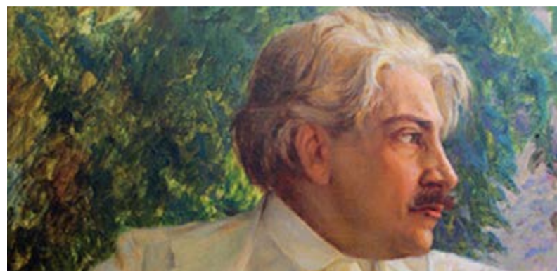
Dr. Osvaldo Cruz