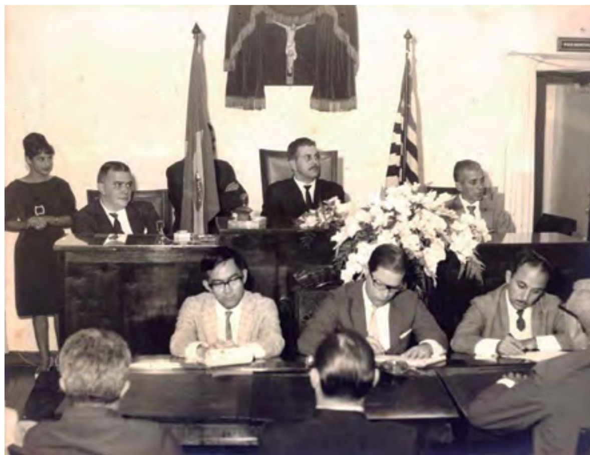
Terceira legislatura da Câmara Municipal de Cubatão 1957 - 1961