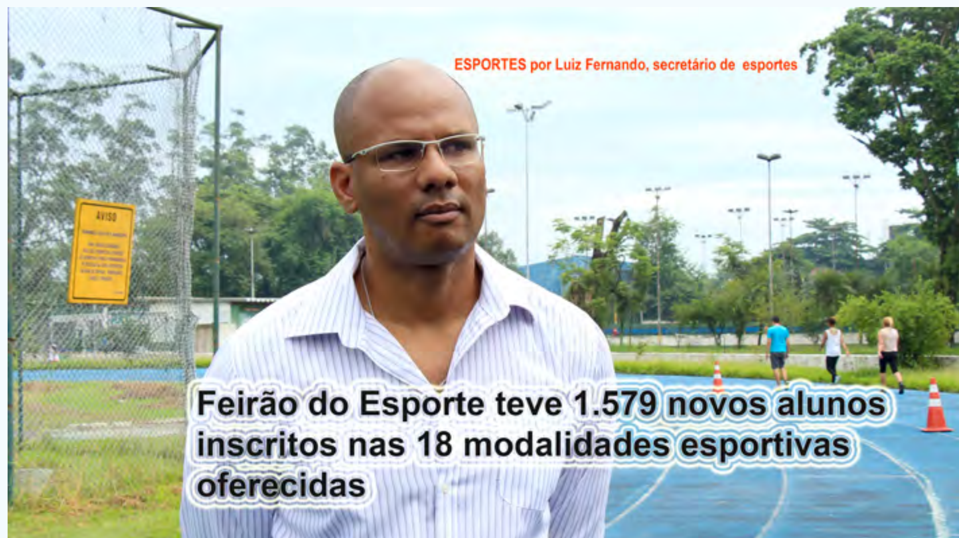
Objetivo da Semes foi alcançado com todas as vagas preenchidas

Foram dois dias dedicados aos cubatenses, interessados em se iniciar na prática esportiva, pudessem se inscrever em uma ou mais das 18 modalidades disponíveis durante o Feirão de Esporte, que a Secretaria Municipal de Esportes e Lazer (Semes) realizou na quarta (17) e quinta-feira (18), no Centro Esportivo Professor Ayrton Romero da Nóbrega, o Romerão.