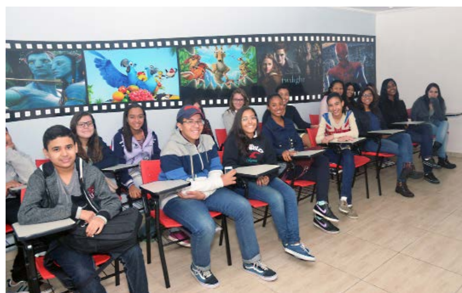
Sala de cinema