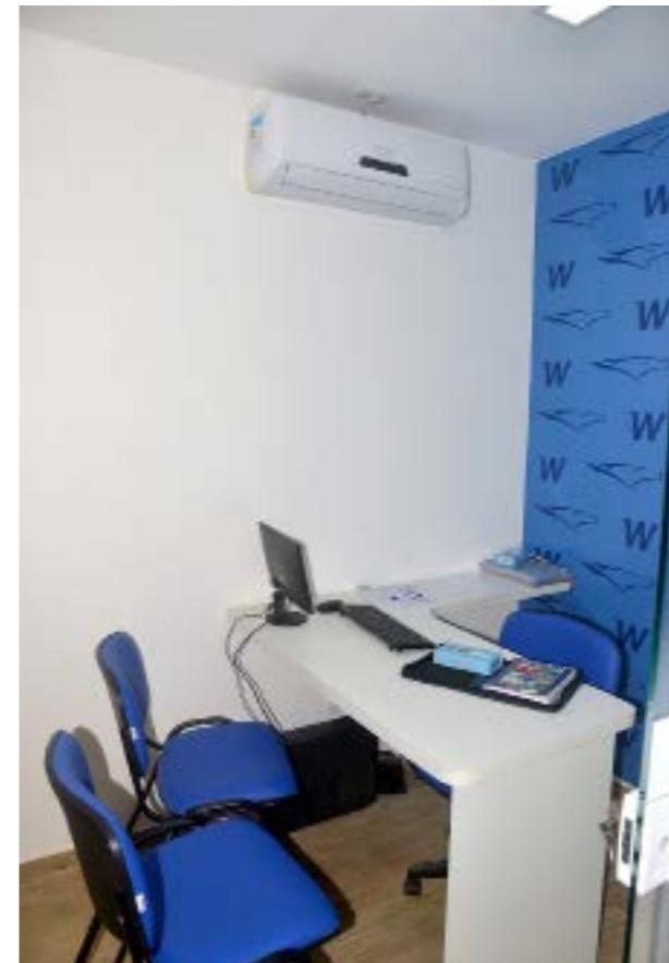
Sala de atendimento