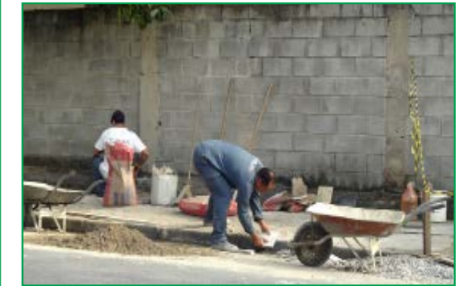
A CURSAN já iniciou os reparos dos buracos na calçada da rua São José.

Todos esses buracos estão na Rua Armando Salles de Oliveira, no centro de Cubatão. Caminhar por aqui, é um risco eminente de sofrer grave acidente. Mulheres, crianças e pessoas idosas, são as mais prejudicadas. Muitas pessoas já se acidentaram nesses buracos. Inúmeras pessoas, reclamaram dessas irregularidades na redação do Jornal Comércio & Indústria. A CURSAN já iniciou os reparos nas proximidades. Estamos cobrando da Empresa a urgente conclusão dos reparos