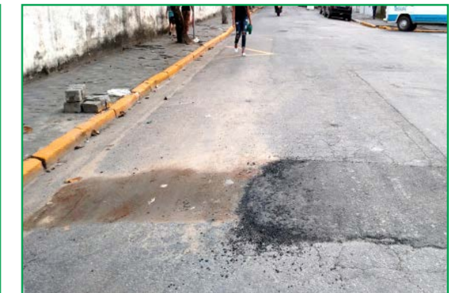
Nesse caso, o reparo foi parcial, ficando muito feio. Fica evidente a falta de capricho com a via pública. A cidade merece muito mais atenção.