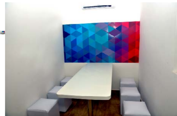
Sala de estudo