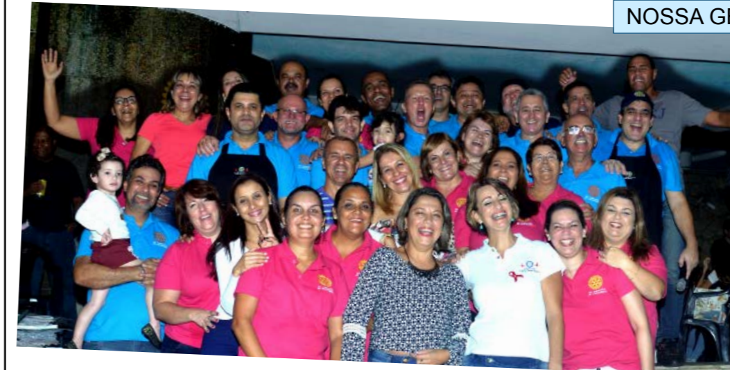
O Rotary Club Cubatão do Jardim Casqueiro promoveu dia 31 de maio, o 7º Bar Rotário. Rolou como sempre, bom papo, churrasco delicioso, banho de piscina e o melhor de tudo companherismo. A renda será destinada aos projetos humanitários