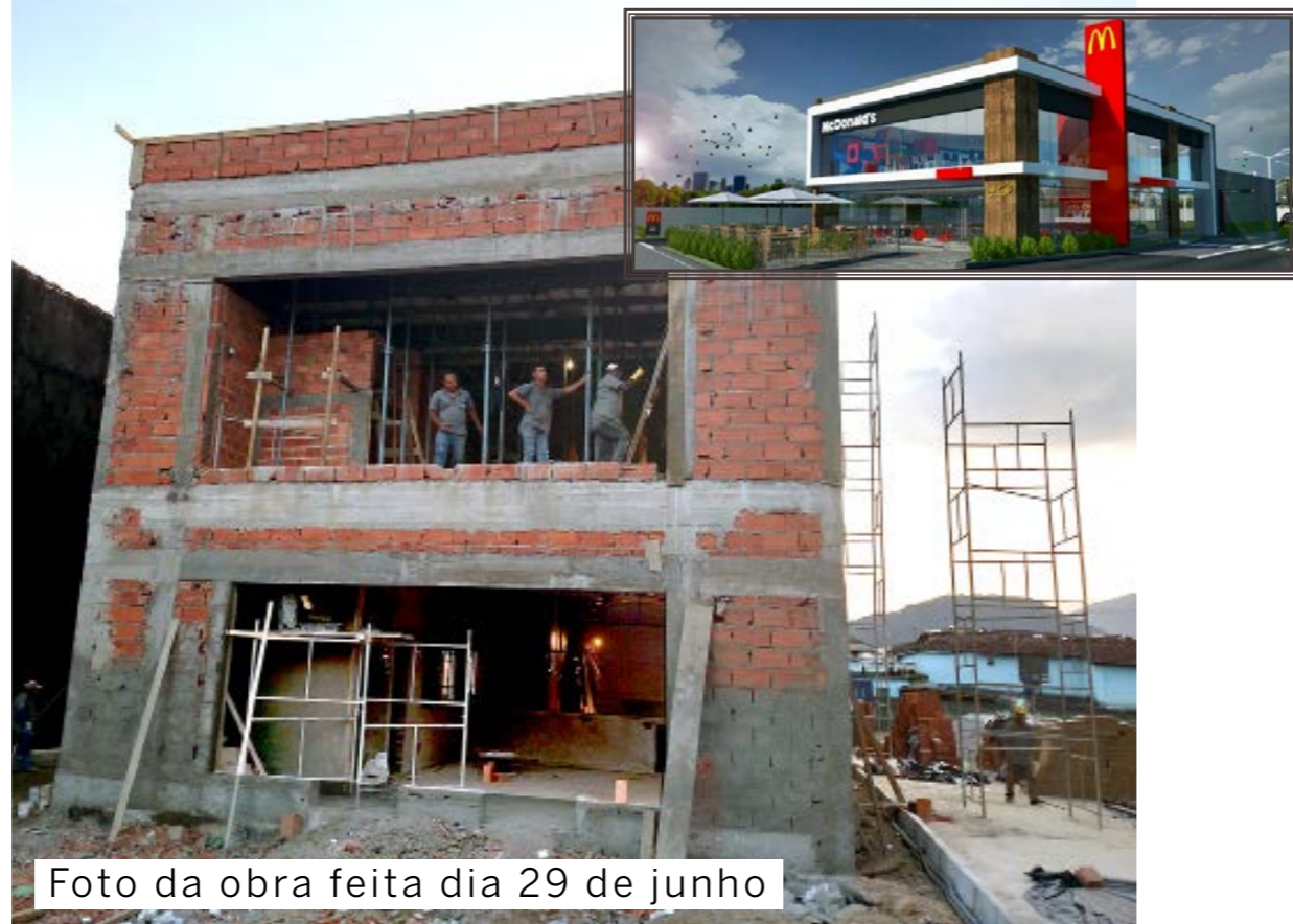
Foto da obra feita dia 29 de junho