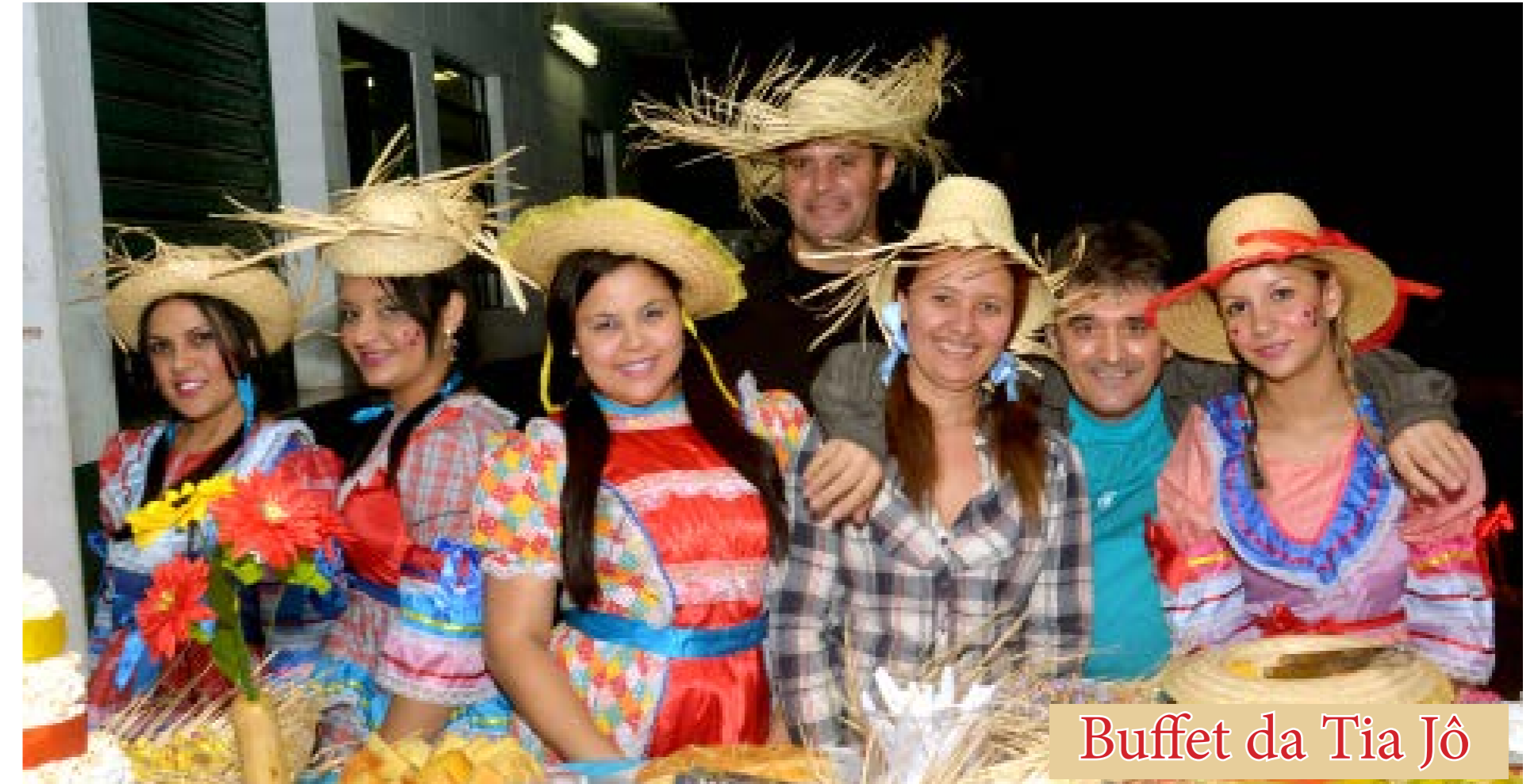
Buffet da Tia Jô