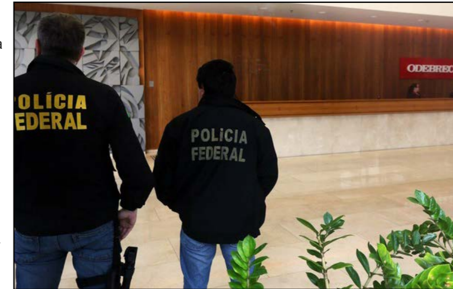
Polícia Federal cumpre mandado na sede da Oderbrecht, em São Paulo. A ação faz parte da 14ª fase da Operação Lava Jato (Operação Erga Omnes)

Operação Lava Jato é o nome de uma investigação realizada pela Polícia Federal do Brasil , cuja deflagração da fase ostensiva foi iniciada em 17 de março de 2014, com o cumprimento de mais de uma centena de mandados de busca e apreensão, prisões temporária, preventivas e conduções coercitivas, tendo como objetivo apurar um esquema de lavagem de dinheiro suspeito de movimentar mais de R$ 10 bilhões. É considerado pela Polícia Federal, como a maior investigação de corrupção da história do País. A operação recebeu esse nome devido ao uso de uma rede de lavanderias e postos de combustíveis pela quadrilha para movimentar os valores de origem ilícita, supostamente, desde 1997. A denúncia inicial partiu do empresário Hermes Magnus, em 2008, quando o grupo de acusados tentou lavar dinheiro na sua empresa Dunel Indústria e Comércio, fabricante de máquinas e equipamentos para certificação. A partir da denúncia