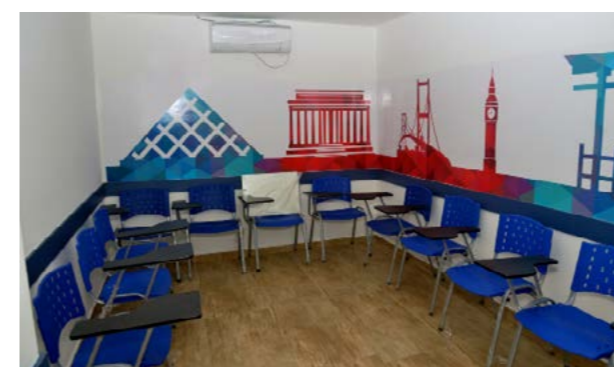
Sala de aula