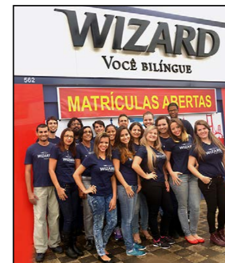
Foto da Capa: Roebbelen Nikon D-800 / Abertura 5,6 Velocidade 250 / ISO 200

Conselho Editorial André Izzi André Simões Louro Luiz Marcelo Moreira Rolando Roebbelen