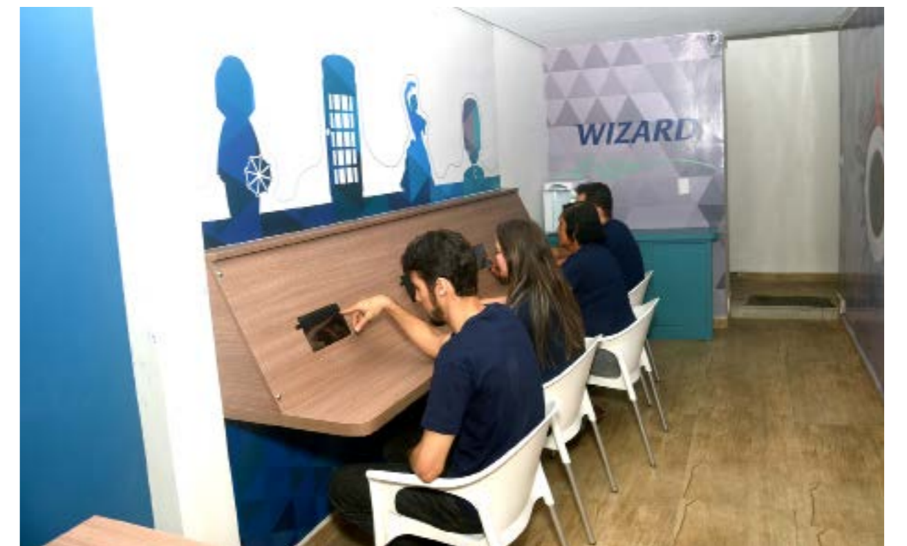
Inovação: cyber com tablets