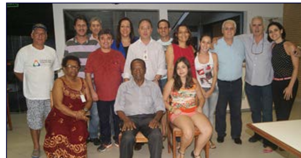
Reunião do CCC Conselho Consultivo Comunitário em dezembro de 2013