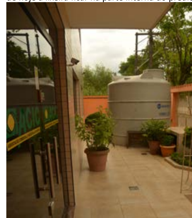
O novo piso cerâmico com a nova caixa d'água de 12 mil litros ao fundo

A implantação de uma lixeira inteligente para deposição de todo o lixo proveniente dos eventos promovidos nos salões e da área administrativa, além da praticidade e modernidade, acabou virando uma referência que vem sendo copiada por várias pessoas para aplicação em estabelecimentos comerciais e mesmo em residências. A particularidade interessante é o fato de hoje a lixeira ficar na parte interna do prédio,