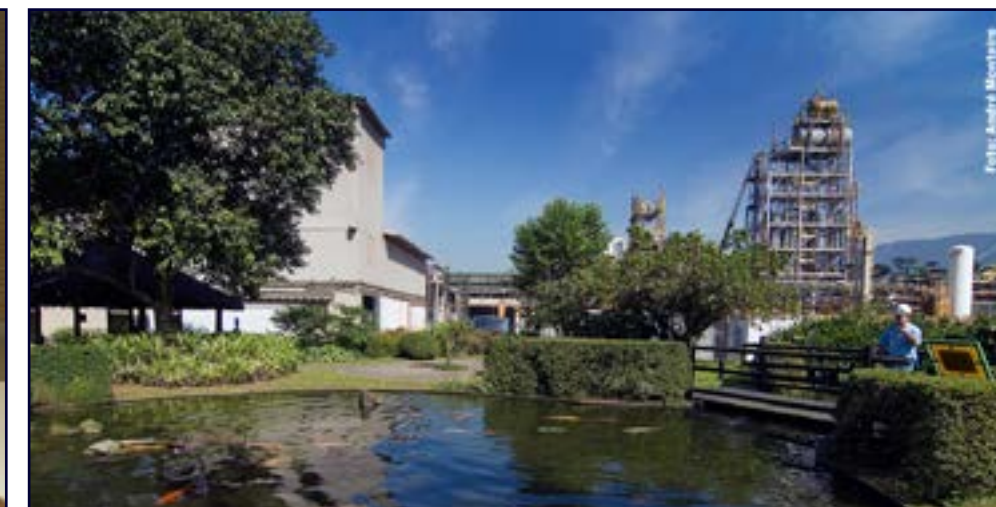
Fábrica com vista da lagoa das carpas