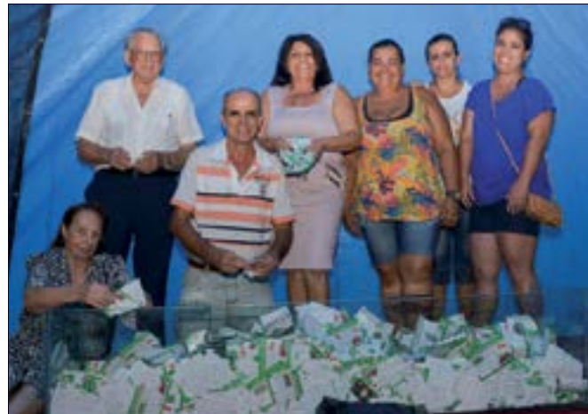
Diretores e funcionários da ACIC organizam os cupons para o sorteio dos prêmios