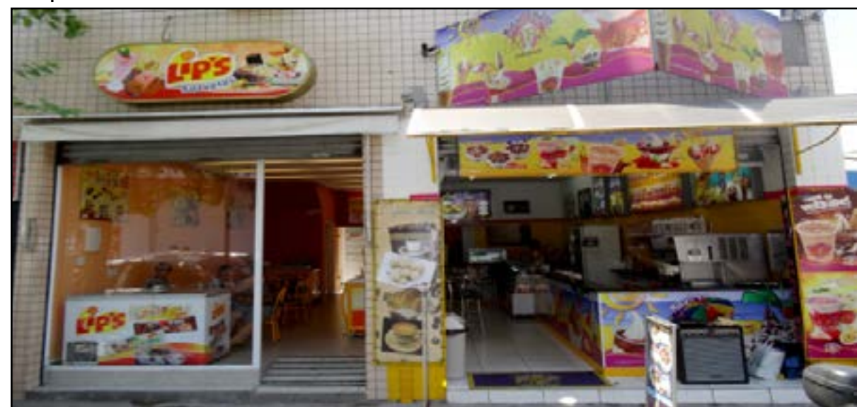
Lojas da Pedro José Cardoso

encantar, cativar e fidelizar cada pessoa que entra em seu comércio.