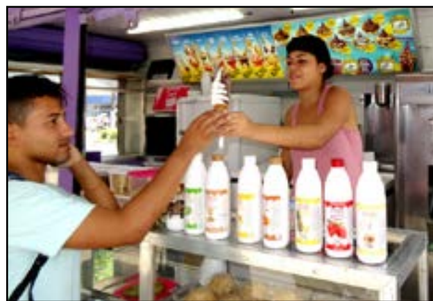
Máquina em frente Casa Flórida