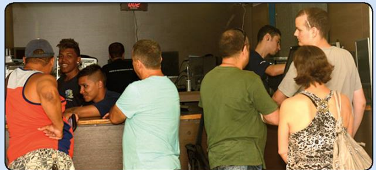
O balcão da manutenção está sempre repleto de clientes em busca de atendimento. Um importante diferencial é o atendimento ser executado na frente do cliente, com total transparência.

A melhoria contínua no atendimento, é meta permanente da direção da S.I., que submete com frequência cada membro da equipe de colabo-