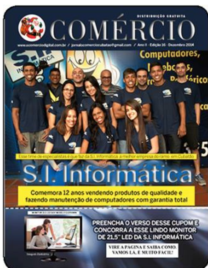
Equipe de Colaboradores da SI INFORMÁTICA

Nikon D-800 / Abertura 6.0 Velocidade 250 / ISO 200 com flash