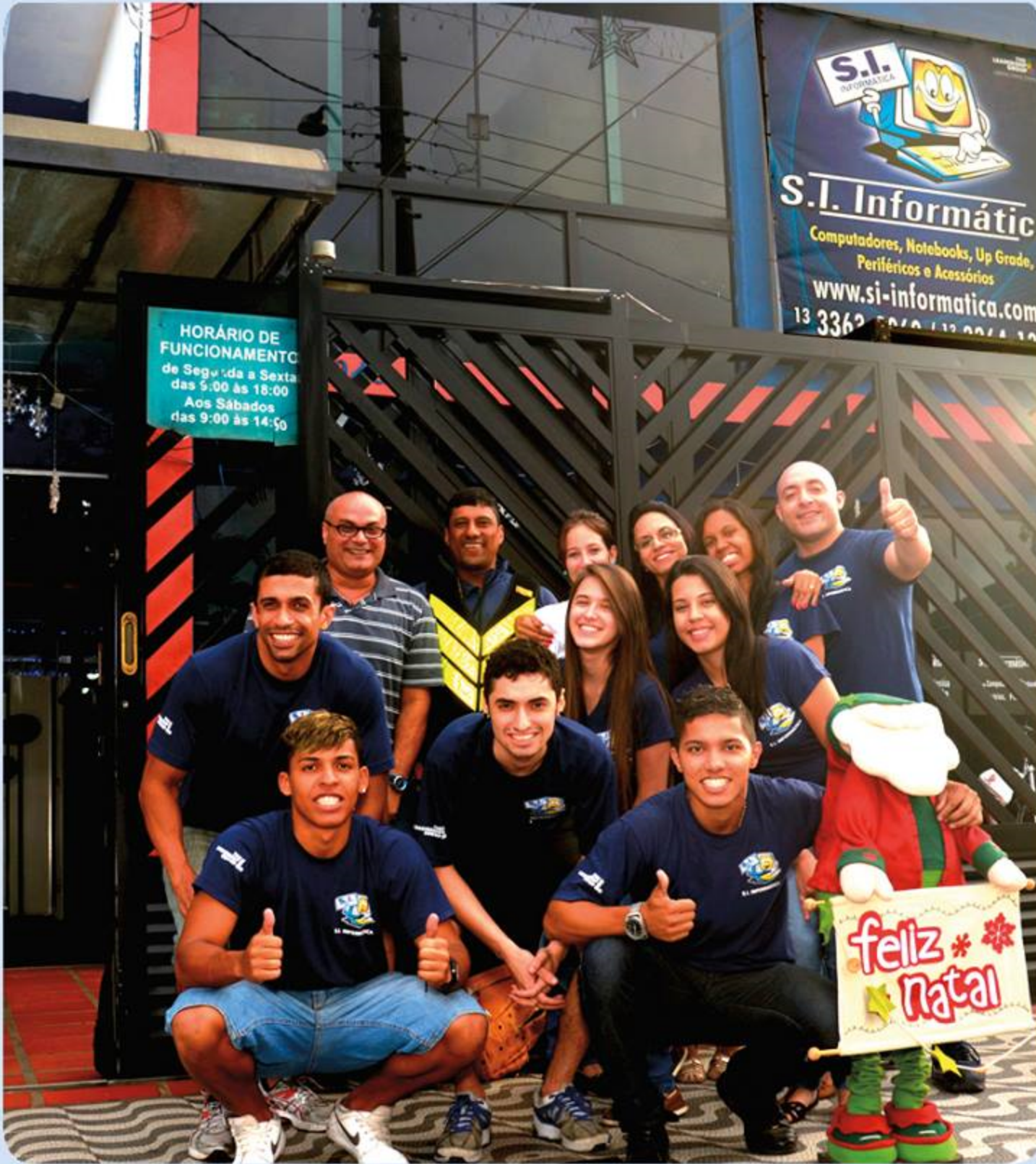
Os colaboradores da S.I. Informática, desejam a todos os clientes e leitores do jornal "O COMÉRCIO", um Feliz Natal e Próspero Ano Novo.

Comemora 12 anos de atividades, vendendo e fazendo manutenção em computadores na Baixada Santista